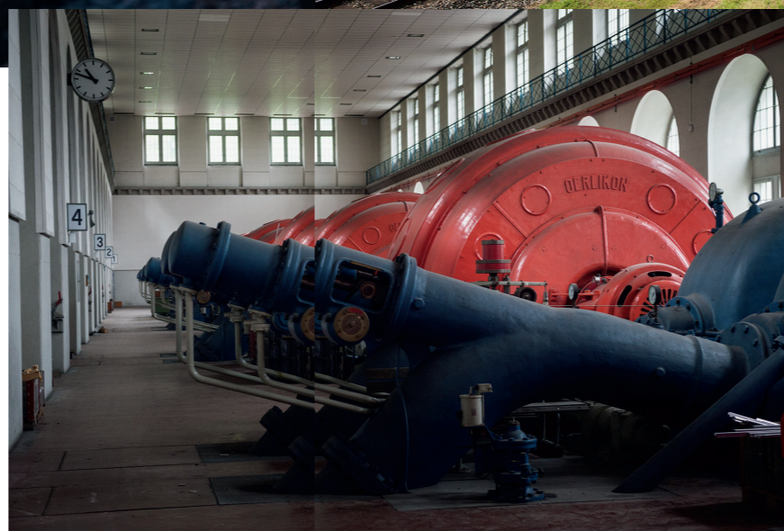
Maschinenhalle des Wasserkraftwerk Amsteg.

Die nachhaltige Beschaffung ist Teil der konzernweiten Nachhaltigkeitsstrategie 2017-2020. Einzelne Elemente der Beschaffung hängen aber auch direkt mit weiteren Strategien der SBB zusammen. So zum Beispiel die Qualität des Bahnstroms, die über die Energiestrategie vorgegeben wird. Mit der Energiestrategie setzen sich die SBB das Ziel, ihren Bahnstrom bis 2025 zu 100 % aus erneuerbaren Energiequellen zu beziehen - heute stammen bereits rund 90 % aus mehrheitlich eigener Wasserkraft. □